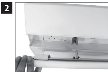
ライトバーを押し上げる