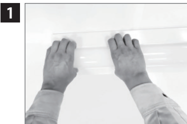
ライトバーを引き出す