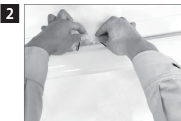
コネクターを外す